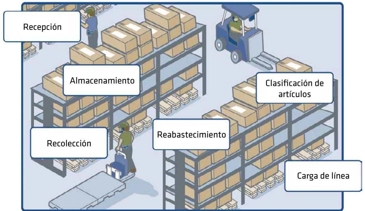
Ilustración de la aplicación